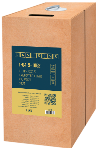
Рисунок 1 - Упаковка