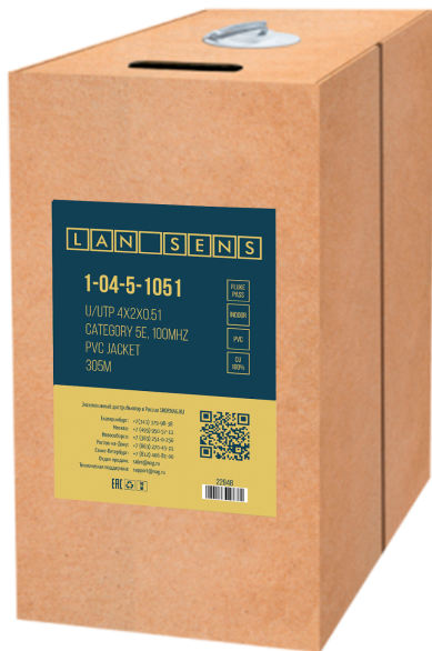
Рисунок 1 - Упаковка