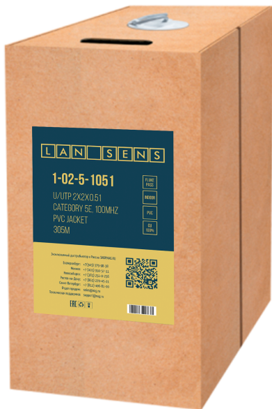
Рисунок 1 - Упаковка